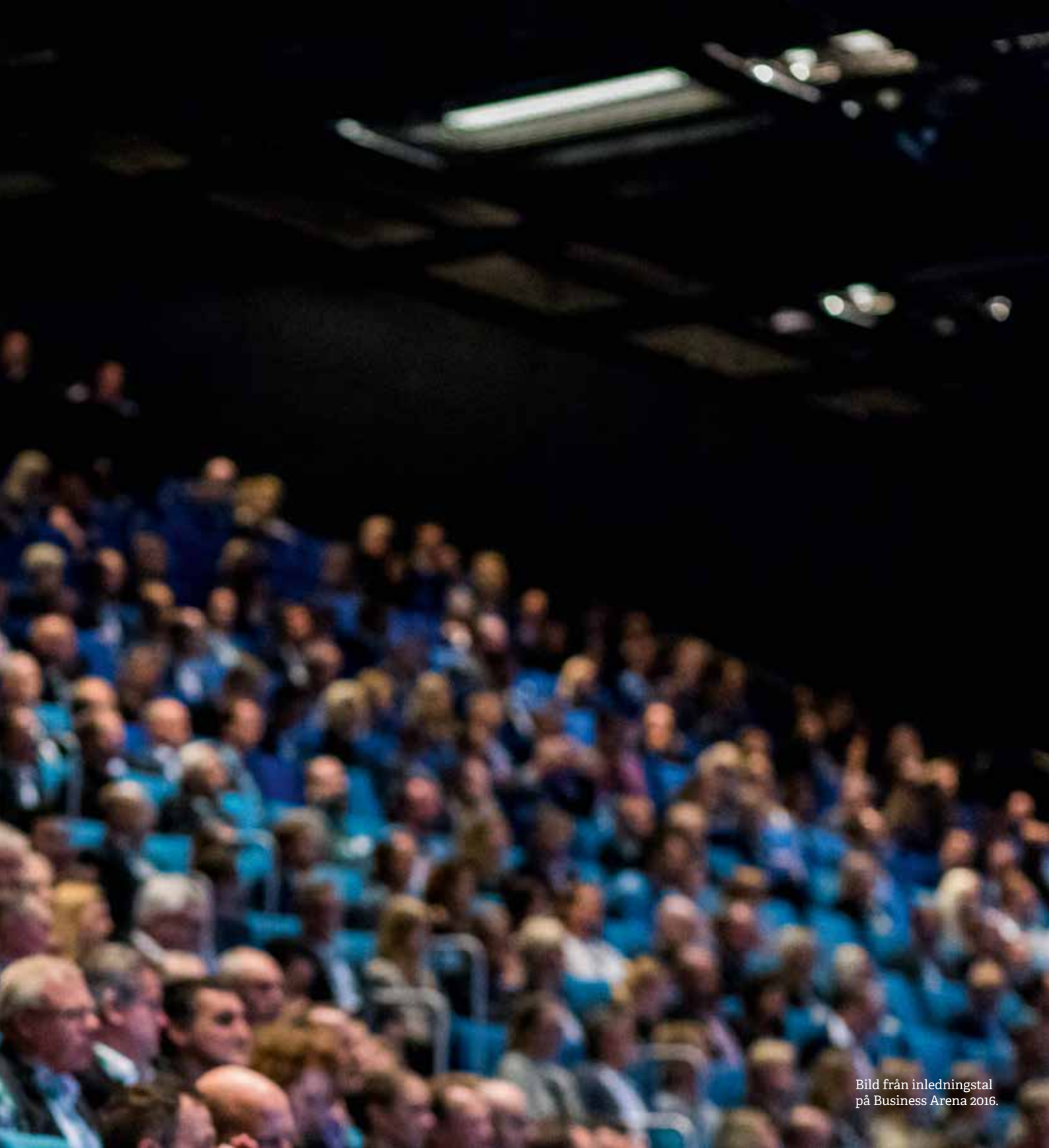
Bild från inledningstal på Business Arena 2016.